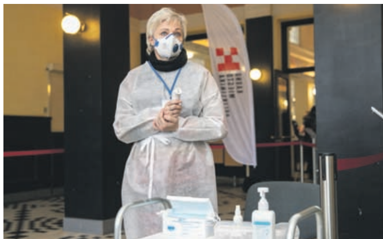
■ Eiga: atvykstantiems pasiskiepyti pamatuojama temperatūra ir jie siunčiami užpildyti anketą.